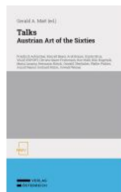
Talks Ladenpreis: 38,00EUR