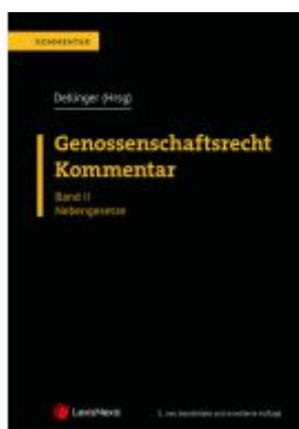
Genossenschaftsrecht - Kommentar Ladenpreis: 189,00EUR