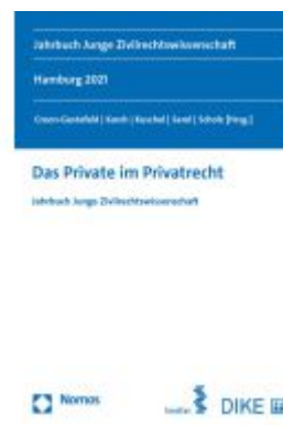
Das Private im Privatrecht Ladenpreis: 81,30EUR