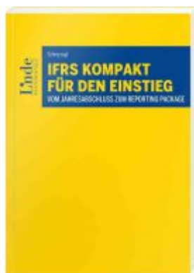
IFRS kompakt für den Einstieg Ladenpreis: 28,00EUR