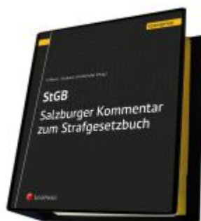
Salzburger Kommentar zum Strafgesetzbuch Ladenpreis: 689,00EUR