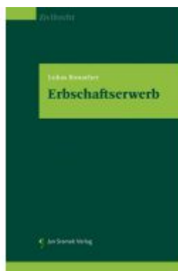
Erbschaftserwerb Ladenpreis: 98,00EUR