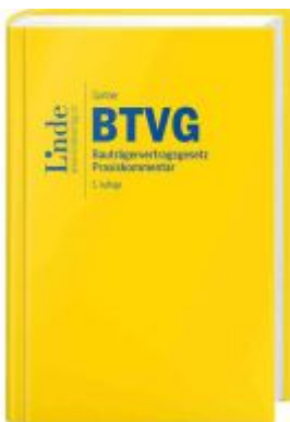
BTVG | Bauträgervertragsgesetz Ladenpreis: 78,00EUR