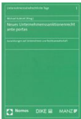
Neues Unternehmenssanktionenrecht ante portas Ladenpreis: 49,00 EUR