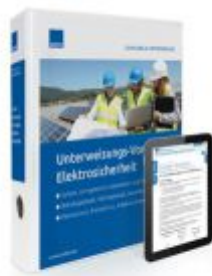
Unterweisungs-Vorlagen Elektrosicherheit Ladenpreis: 207,90 EUR