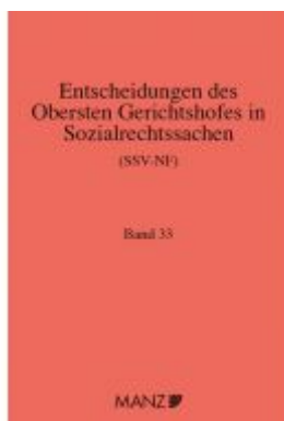
Entscheidungen des obersten Gerichtshofes in Sozialrechtssachen SSV- NF Ladenpreis: 320,00 EUR