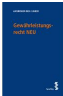
Gewährleistungsrecht NEU Ladenpreis: 54,00 EUR