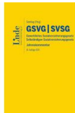
GSVG & SVSG | Gewerbliches Sozialversicherungsgesetz & Selbständigen-Sozialversicherungsgesetz Ladenpreis: 145,00 EUR