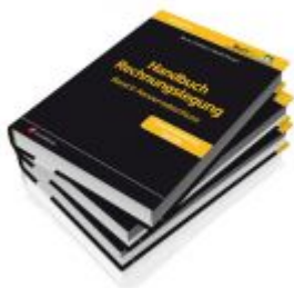
PAKET Handbuch Rechnungslegung, Bände 1 bis 3 Ladenpreis: 351,00 EUR