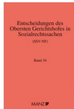
Entscheidungen des obersten Gerichtshofes in Sozialrechtssachen SSV- NF Ladenpreis: 322,00EUR