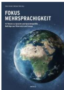
Fokus Mehrsprachigkeit. Ladenpreis: 36,00EUR