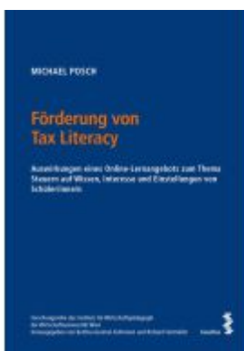
Förderung von Tax Literacy Ladenpreis: 63,00EUR