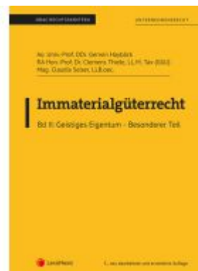
Immaterialgüterrecht (Skriptum) - Bd II Ladenpreis: 36,00EUR