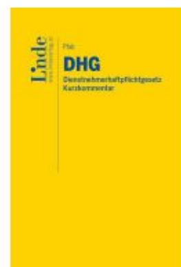
DHG I Dienstnehmerhaftpflichtgesetz Ladenpreis: 48,00EUR