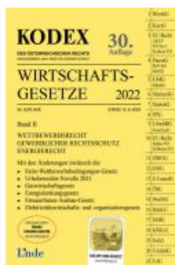
KODEX Wirtschaftsgesetze Band II 2022 Ladenpreis: 61,00EUR