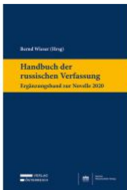
Handbuch der russischen Verfassung - Ergänzungsband zur Novelle 2020 Ladenpreis: 149,00EUR