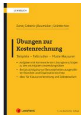
Übungen zur Kostenrechnung Ladenpreis: 39,00EUR