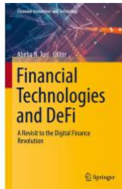
Financial Technologies and DeFi Ladenpreis: 98,99EUR