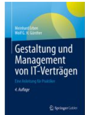
Gestaltung und Management von IT-Verträgen Ladenpreis: 56,53EUR