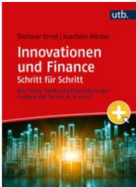
Innovationen und Finance Schritt für Schritt Ladenpreis: 28,70EUR