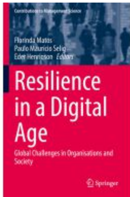
Resilience in a Digital Age Ladenpreis: 175,99EUR