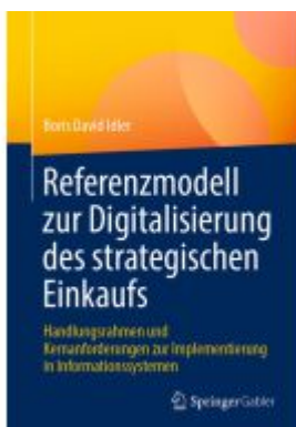
Referenzmodell zur Digitalisierung des strategischen Einkaufs Ladenpreis: 39,06EUR