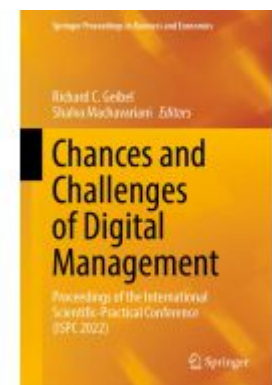
Chances and Challenges of Digital Management Ladenpreis: 164,99EUR