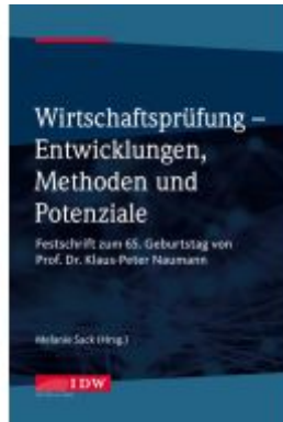
Wirtschaftsprüfung - Entwicklungen, Methoden und Potenziale Ladenpreis: 153,20EUR