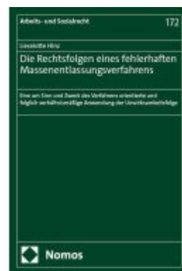
Die Rechtsfolgen eines fehlerhaften Massenentlassungsverfahrens