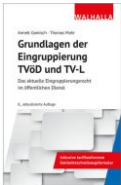
Grundlagen der Eingruppierung TVöD und TV-L