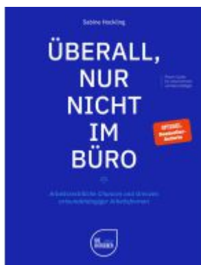
Überall, nur nicht im Büro