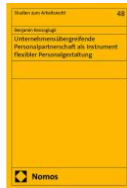
Unternehmensübergreifende Personalpartnerschaft als Instrument flexibler Personalgestaltung