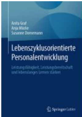
Lebenszyklusorientierte Personalentwicklung Ladenpreis: 56,53EUR