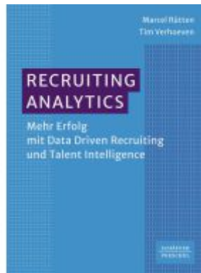
Recruiting Analytics Ladenpreis: 51,40EUR