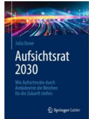
Aufsichtsrat 2030 Ladenpreis: 51,39EUR