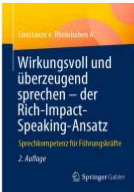
Wirkungsvoll und überzeugend sprechen – der Rich-Impact-Speaking-Ansatz Ladenpreis: 35,97EUR