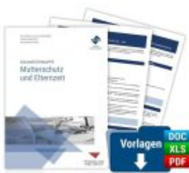
Dokumentenmappe Mutterschutz und Elternzeit Ladenpreis: 144,10EUR