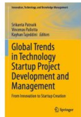
Global Trends in Technology Startup Project Development and Management Ladenpreis: 197,99EUR