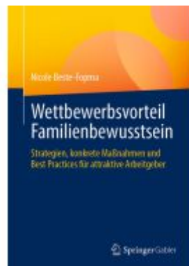
Wettbewerbsvorteil Familienbewusstsein Ladenpreis: 41,11EUR