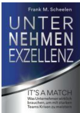
Unternehmen Exzellenz Ladenpreis: 29,90EUR