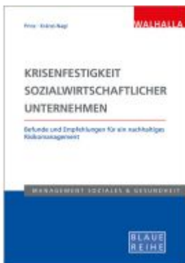
Krisenfestigkeit sozialwirtschaftlicher Unternehmen Ladenpreis: 36,00EUR

Wir haben andere Produkte gefunden, die Ihnen gefallen könnten!