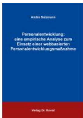
Personalentwicklung: eine empirische Analyse zum Einsatz einer webbasierten Personalentwicklungsmaßnahme Ladenpreis: 87,20EUR