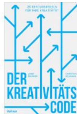
Der Kreativitätscode Ladenpreis: 30,70EUR