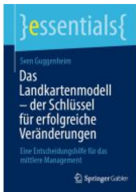
Das Landkartenmodell – der Schlüssel für erfolgreiche Veränderungen Ladenpreis: 15,41EUR