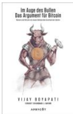
Im Auge des Bullen – Das Argument für Bitcoin Ladenpreis: 21,60EUR