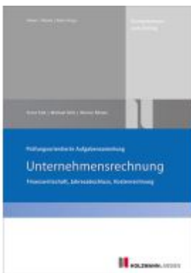
Prüfungsorientierte Aufgabensammlung "Unternehmensrechnung" Ladenpreis: 20,50EUR