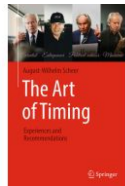
The Art of Timing Ladenpreis: 49,49EUR