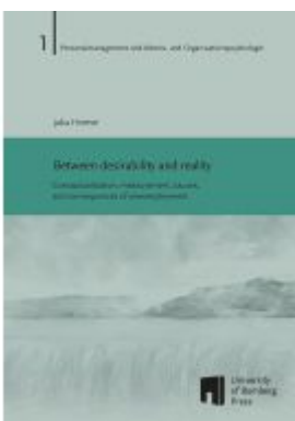
Between desirability and reality Ladenpreis: 24,70EUR