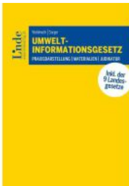
Umweltinformationsgesetz Ladenpreis: 39,00EUR

Wir haben andere Produkte gefunden, die Ihnen gefallen könnten!