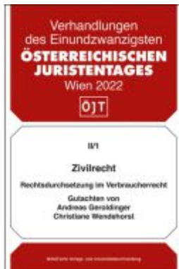
Zivilrecht Rechtsdurchsetzung im Verbraucherrecht - materiellrechtliche und prozessuale Aspekte Ladenpreis: 58,00EUR