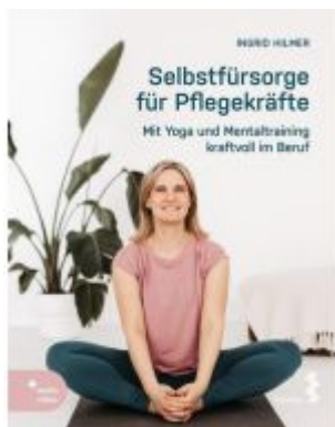
Selbstfürsorge für Pflegekräfte Ladenpreis: 24,90EUR