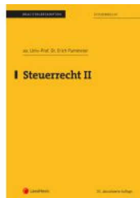
Steuerrecht II (Skriptum) Ladenpreis: 18,75EUR