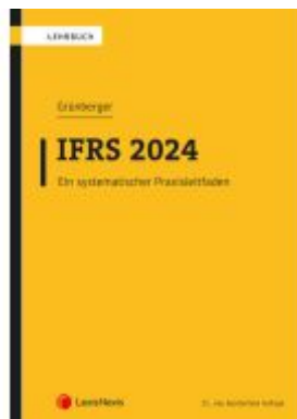
IFRS 2024 Ladenpreis: 49,00EUR