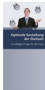
Optimale Gestaltung der Gleitzeit Ladenpreis: 16,50EUR