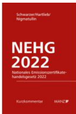
Nationales Emissionszertifikatehandelsgesetz 2022 NEHG 2022 Ladenpreis: 84,00EUR